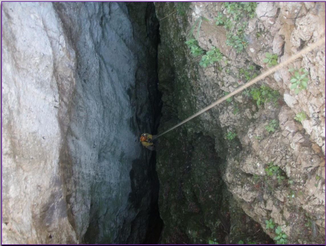
Pou d'entrada de l'Avenc del Gitano, Barxeta.

El dissabte 23 d'abril es va anar a la zona de Barx, per visitar L'AVENC DE LES VIOLETES , sent aquesta la primera volta quès visitava la cavitat en qüestió. I ja en l'últim cap de setmana d'abril es va visitar la cavitat alacantina del REBALSO , no poden concloure l'activitat per trobar-se en la base del segon pou restes d'animals en descomposició.