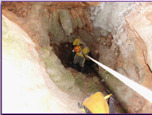
Avenc del Pla d'Alcalà.

Ja en el mes de juliol el nostre club es desplaça a Conca per visitar el SUMIDERO DE MATASNOS , clàssica cavitat d'aquesta província, aquesta activitat fos duta a terme el cap de setmana del 9 i 10 d'aquest mes, el cap de setmana següent es visita L'AVENC DEL PLA D'ALCALÀ , en la localitat d'Alcalà de la Jovada. El divendres 22 es desplaçem cap a la Serra de Guara en Huesca per realitzar la visita esportiva a LA GRALLERA DE GUARA , avenc que conta amb un primer pou de 280 metres de vertical, encara que aquesta visita fos frustrada per l'accés a la mateixa, ja que el camí es trobava en pèssimes condicions, impossibilitant l'accés a la cavitat.