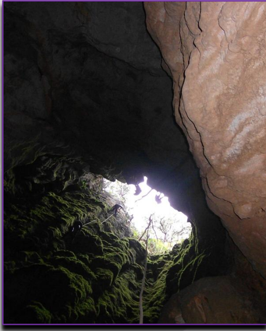
L'Avenc Estret, en La Vall d'Ebo.