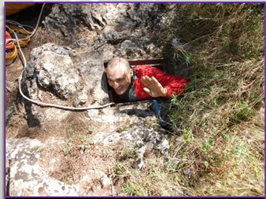
Entrada a l'Avenc dels Conills.