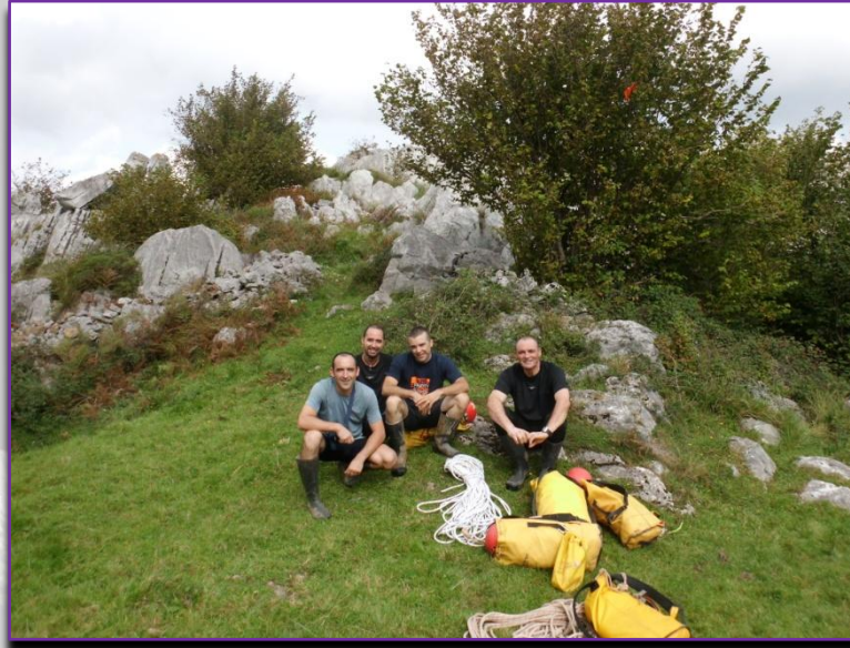
Abans d'entrar a Tonio-Cañuela

Al primer cap de setmana de setembre l'activitat del club s'inicia amb la visita esportiva a L'AVENC DEL MIG en la localitat de la Vall d'Ebo. El cap de setmana següent s'aprofita per començar els treballs de topografia a L'AVENC DE FIGUEROLES . El divendres 23 es va desplaçar pràcticament la totalitat del club a Cantabria per realitzar la clàssica travessia de TONIO-CAÑUELA .