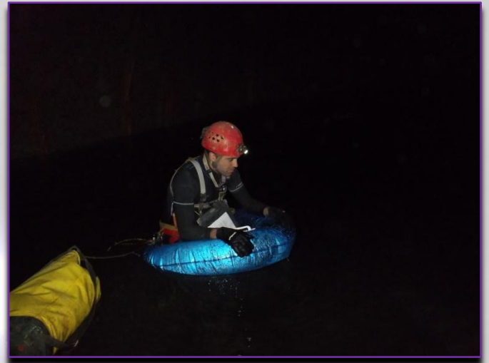
Dos moments en Cueto-Coventosa.