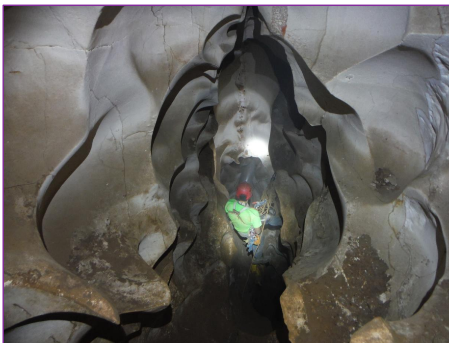
Espectaculars formacions geològiques en la Sima de Benis.