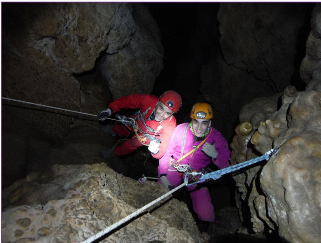
Durant el descens en la Sima de la Cebolleja.

La jornada va transcórrer sense cap incidència, on durant el descens i amb les dues vies instal·lades, el nostre company va estar acompanyat en tot moment, poden realitzar d'aquesta forma totes les tècniques de manera segura, alhora que gaudia de l'experiència.