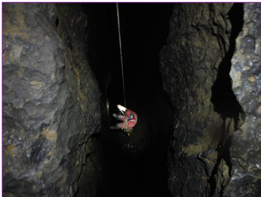
Descens d'un dels pous en Txomin VIII.

La visita a aquesta clàssica cavitat de la zona Karrantza, la vam poder realitzar sense cap problema, gaudint tant dels transcurts per les galeries de mina, com en el descens dels espectaculars pous de la cavitat fins arribar, a les no menys sensacionals galeries del sector intermedi de la cavitat.