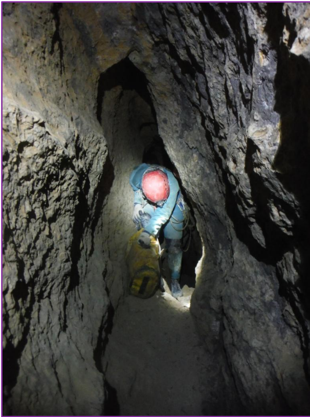
Un dels moments a Cueva Fresca.