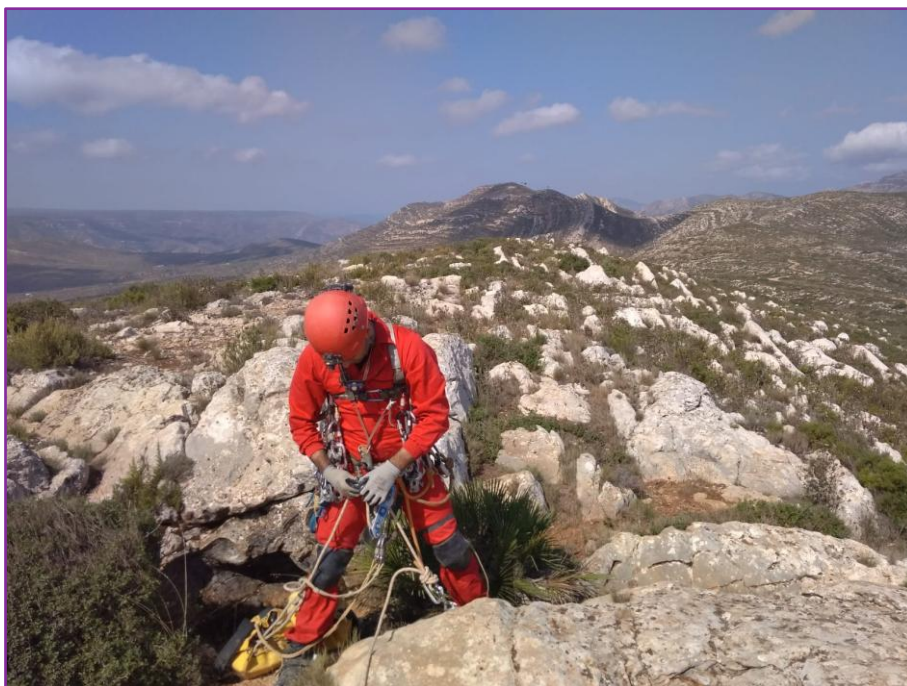
Iniciant el descens en la Sima del Caballón.