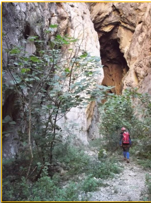
Entrando a Hundidero-Gato.